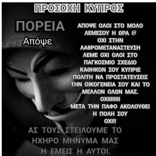
Κάλεσμα σε πορεία απο την συνομοσιολογική σελίδα στο fb "Ανώνυμοι"

Όταν συγκεντρώθηκαν στον πεζόδρομο του Μώλου, το κεντρικό πανό έλεγε «Refugees not welcome» και φώναζαν εθνικιστικά συνθήματα όπως «Η Κύπρος είναι Ελληνική». Από την αρχή της πορείας άρχισαν να επιτίθενται σε δημοσιογράφους και σε μετανάστες περαστικούς. Καθώς περπατούσαν στον πεζόδρομο, έριξαν βίαια ανθρώπους στην θάλασσα, επιτέθηκαν σε κόσμο που περπατούσε στον Μώλο, μέχρι που η αστυνομία έριξε δακρυγόνα και η πορεία έσπασε σε μικρές ομάδες ατόμων. Αφού έσπασε, κάποια κομμάτια της πορείας αντεπιτέθηκαν στους μπάτσους και άλλα κατευθύνθηκαν προς την πάνω μεριά του παραλιακού δρόμου, όπου έσπασαν πολλά μαγαζιά μεταναστών όπως φαγάδικα, σουπερμάρκετ, κουρεία κα. Μέχρι αργά το βράδυ, έγιναν δεκάδες άγριες επιθέσεις σε διάφορους μετανάστες, όπως ντελιβεράδες, περαστικούς τουρίστες ή και σε επιβαίνοντες σε αυτοκίνητα: κατέβαζαν κόσμο από τα αυτοκίνητα, και αν ήταν μετανάστης του επιτίθονταν. Επιθέσεις δέχτηκαν ακόμα και ντόπιος κόσμος που αντιδρούσε στο πογκρόμ, με μαρτυρίες ακόμα και για ρίψη μολότοφ σε κόσμο που πήγε να βοηθήσει τους μετανάστες που δέχτηκαν επίθεση. Όλα αυτά έγιναν με τις πλάτες της πάνοπλης αστυνομίας (είχε μέχρι και αντιοχλαγωγικό όχημα εκείνο το βράδυ) η οποία δεν έκανε τίποτε για να σταματήσει το πογκρόμ, ενώ μάλιστα τα πλείστα περιστατικά γίνονταν σε πολύ κοντινή απόσταση απο τις διμοιρίες των μπάτσων. Μέχρι το τέλος της νύχτας, οι πάνω από 100 πάνοπλοι μπάτσοι συνέλαβαν 13 άτομα.[18]